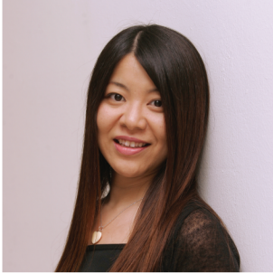
Masami Dakeuchi , PhD Safety Officer Food and Agriculture Organization of the United Nations (FAO)